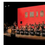
【ゲストアーティスト】 スノーマンスター ジャズオーケストラ