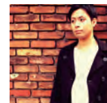
【ゲストアーティスト】 ヴォーカリスト 林部智史(はやしべさとし)